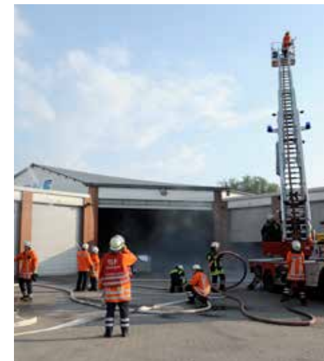
Auf dem Foto der Feuerwehr Clauen (unten) ist er übrigens selbst bei einem Löschangriff zu sehen